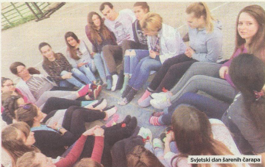
Svjetski dan šarenih čarapa