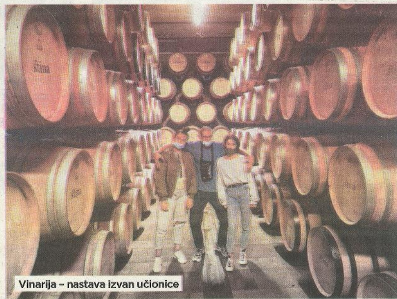
Vinarija - nastava izvan učionice

Na spomenutom natjecanju knjiga je osvojila treće mjesto u svijetu u jednoj od kategorija. Nakon ovoga knjiga ima pravo na certifikat Best in the World.