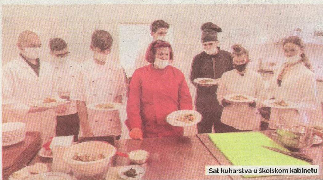
Sat kuharstva u školskom kabinetu